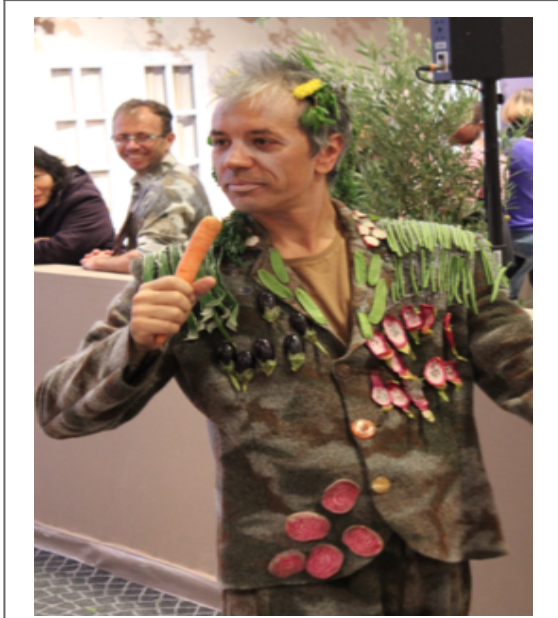
El candidato de “Europa de Marrakech a Estambul”

EUROPIRATAS: “Democracia: demos(pueblo)+kratos(poder)”