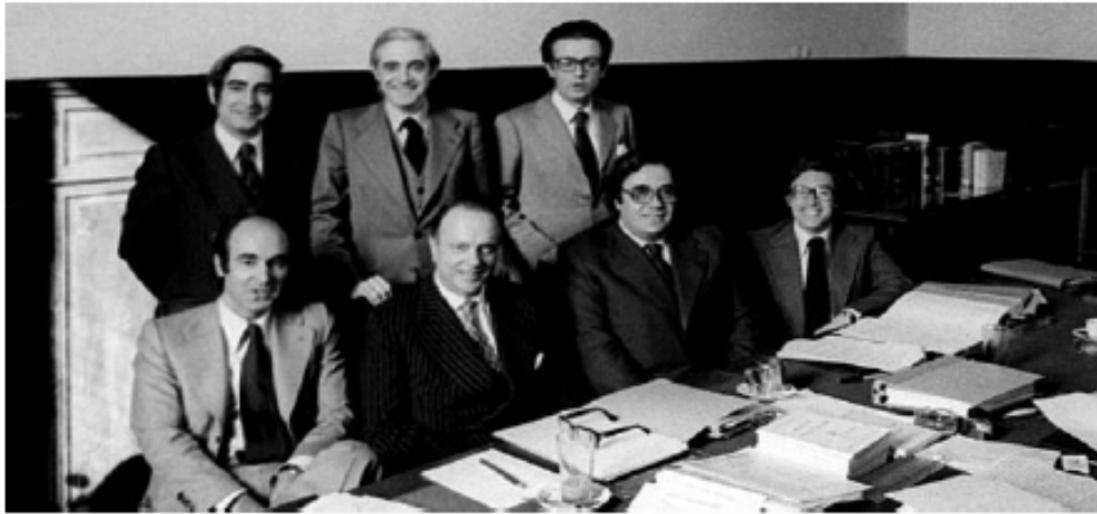
Junto a los otros "padres" de la Constitución de 1978, fieles servidores del capital español

no pocas facilidades (!!) en las relaciones con las autoridades. . . En el consejo de administración de un banco importante hallamos generalmente a un miembro del parlamento o del ayuntamiento de Berlín””