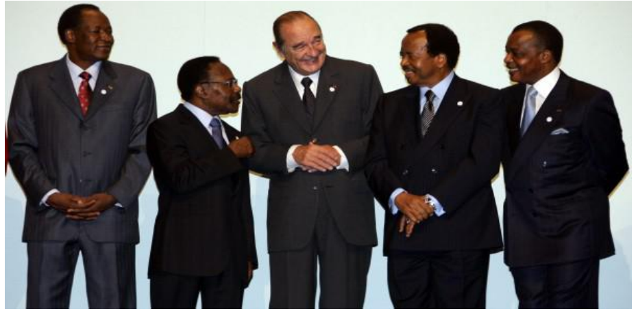
Jacques Chirac con Blaise Compaoré, Omar Bongo, Paul Biya y Denis Sassou