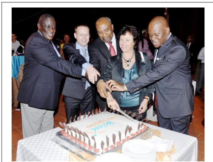
Bolloré y sus socios se reparten el pastel de Uganda a través de la Bolloré Africa Logistics Uganda

Estos monopolios controlan los sectores estratégicos y más lucrativos de la economía africana. Algunos ejemplos son: