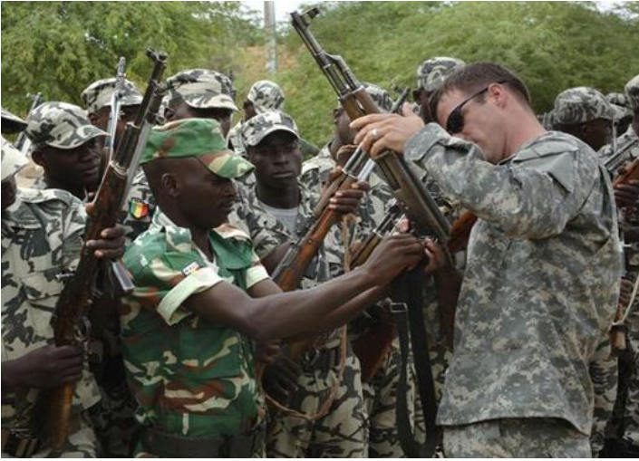
Militares yanquis adiestrando a soldados africanos

A pesar del intento de repartirse de forma “ pacífica ” los continentes de todo el planeta tratando de establecer una supuesta “ libertad de comercio ”, ésta es borrada del mapa constantemente por el desarrollo de los monopolios que se expanden y colisionan entre sí. Es esa la raíz de las guerras, ya sea directamente entre las potencias imperialistas (Primera y Segunda Guerra Mundial) o bien entre ejércitos locales armados por ellos mismos. Una vez que estos grupos armados locales (ya se les llame “ rebeldes ”, “ islamistas ”, “ terroristas ”) se les van de las manos e impiden la “ pacífica ” extracción de los recursos por los monopolios de las potencias imperialistas, los ejércitos de estas últimas intervienen en nombre de la seguridad y de la lucha anti-terrorista.