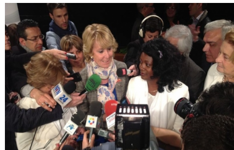
Esperanza Aguirre apoyando a las Damas de Blanco

« Reclaman que se prolonguen las ayudas económicas por cinco años más, se les homologuen los títulos universitarios y se les dé cobertura de salud gratuita, incluyendo el pago de los tratamientos dentales . » 6