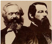
Marx y Engels